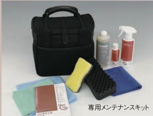
専用メンテナンスキット